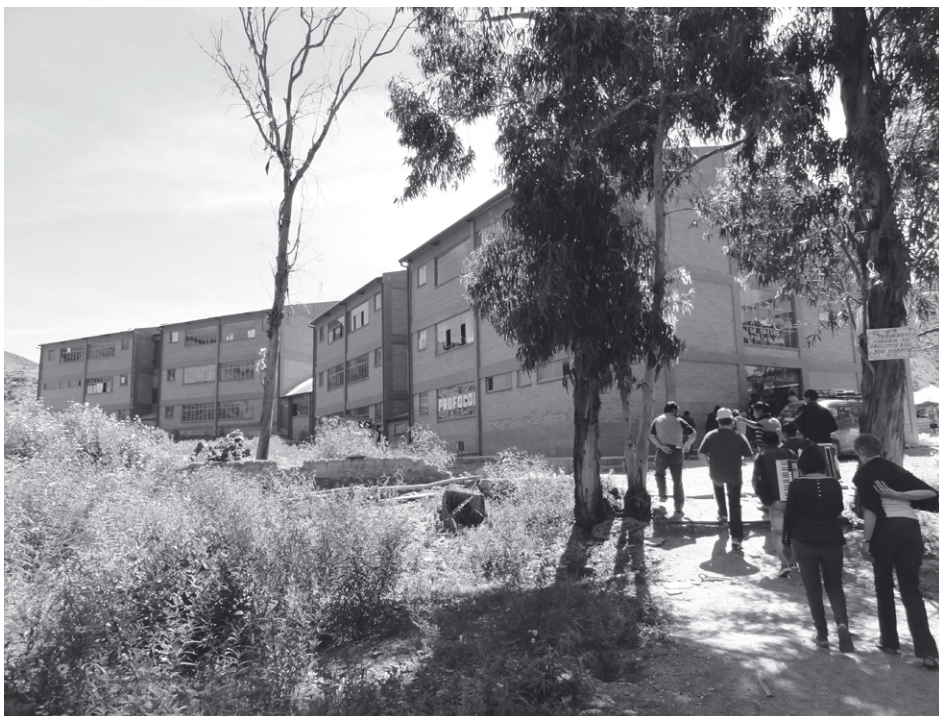
> Normalschool: leslokalen

Na de vergadering eten we samen. Ze moeten van alles weten over ons landje. Ze kunnen zich moeilijk voorstellen dat België relatief vlak is, geen hoge bergen heeft, veel wegen, een grote bevolkingsdichtheid. Als ze horen dat er hier veel auto's rijden hebben ze medelijden met onze gezondheid: er moet hier veel smog hangen. Dat zij dat idee hebben is niet zo verwonderlijk als je kijkt naar de uitlaatgassen van de Boliviaanse auto's. In de stad stinkt het werkelijk verschrikkelijk. Na die gezellige avond kruipen we tevreden in ons nestje. ▼