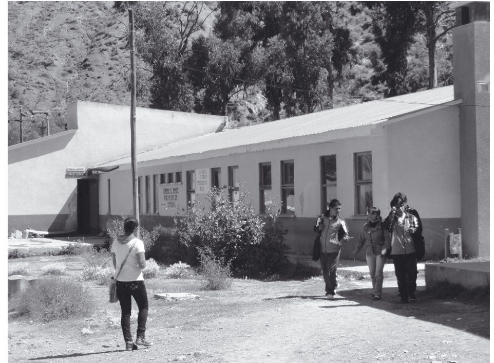
> Verblif studenten