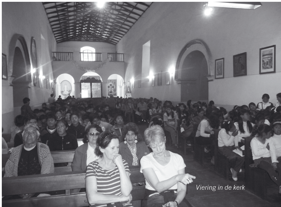
Viering in de kerk

Een oud-leerling begeleidde ons dan naar de normaalschool. Die is van de staat en werd gebouwd door de Boliviaanse overheid. De school heeft fantastische gebouwen, een luxe in Caiza. De klaslokalen zijn groot en heel wat staan leeg. We stappen een klaslokaal binnen. Er hangen plakkaats met Spaanse woorden maar ook met Quechua. Ook die taal wordt in de scholen onderwezen. De les is juist gedaan. In de groep zitten veel meisjes en maar twee jongens. Ze stellen ons vragen over België. Er heerst een drukte op de campus. We bezoeken de bibliotheek waar internet aanwezig is. Er zijn twee internaten aan de school verbonden: één voor de jongens en één voor de meisjes. Het zijn moderne gebouwen met een refter. We nemen afscheid van de oud-leerling en trekken terug naar het parochiehuus voor de vergadering met de equipe: de twee directeurs van de scholen, de econoom en de padre. De padre legt uit dat ze proberen om de school officieel te laten erkennen. Want officieel op papier bestaat het college niet, al erkent de staat de diploma's en hebben ze medailles gekregen voor hun 50-jar bestaan. Er is echter nergens een stichtingsakte te vinden.