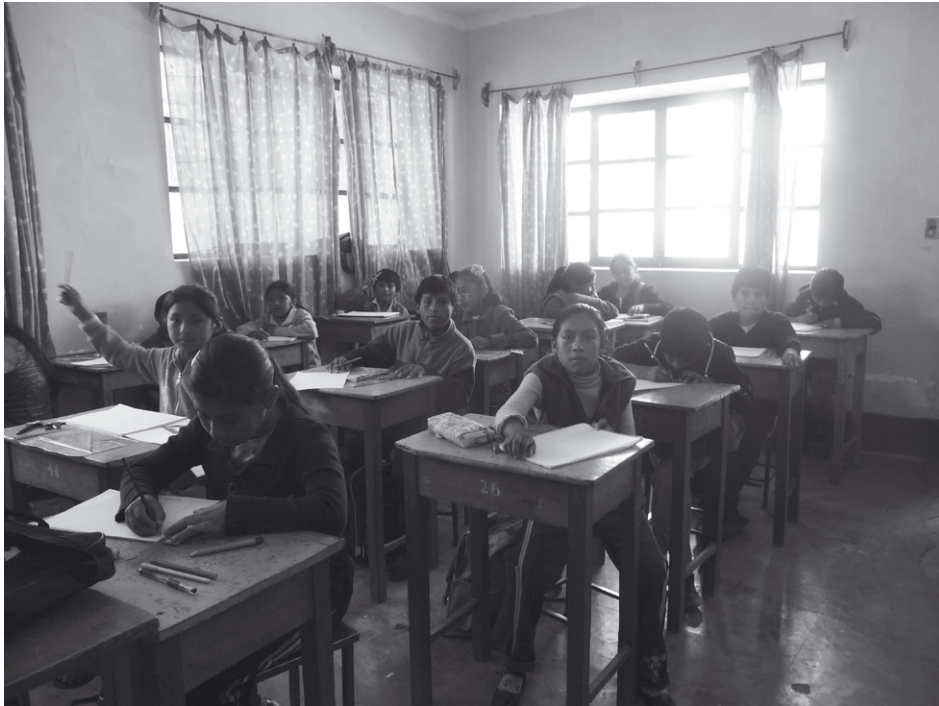
> Lagere school